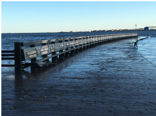
Højvande ved strand molen