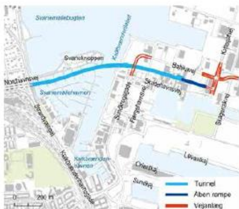
Figur 2.2 Placering af tunnelen i løsning B fra Nordhavnsvej til Kattegatvejs forlængelse på Nordhavn. Også nye lokale vejanlæg er vist.