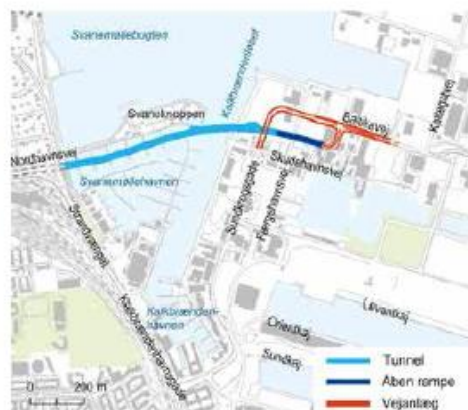
Figur 2.4 Placering af tunnelen i løsning D fra Nordhavnsvej til øst for Færgehavnsvej på Nordhavn. Også nye lokale vejanlæg er vist.