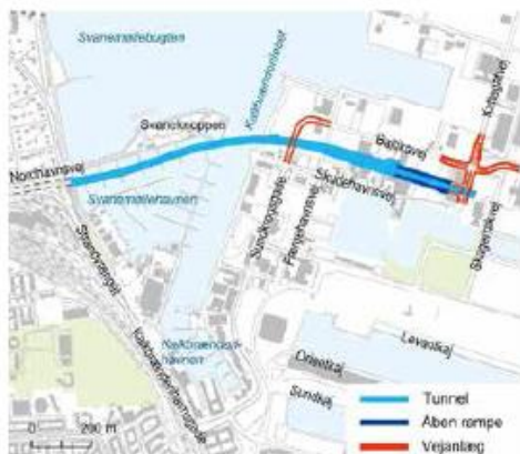
Figur 2.1 Placering af tunnelen i løsning A fra Nordhavnsvej til Kattegatvejs forlængelse på Nordhavn. Også nye lokale vejanlæg er vist.